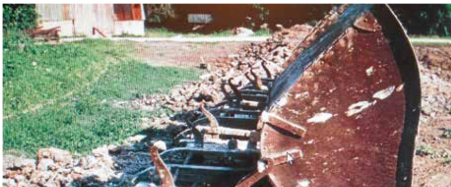
Tipvogn på Aastrup Kalkværk.