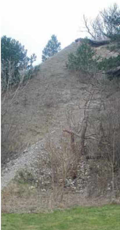
Stien til toppen af Skuldelev Ås.

Efter traveturen kommer vi tilbage til udgangspunktet, hvorefter vi kører i bil til Skuldelev Havn. På en bakke højt over havnen spiser vi den medbragte frokost og nyder den gode udsigt over fjorden, Peberrenden og øen Hyldeholm, som er ejet af en naturistforening. I Peberrenden udgravede man i 1962 fem sænke-ede vikingskibe (Skuldelev-skibene), der i dag befinder sig på Vikingeskibsmuseet i Roskilde.