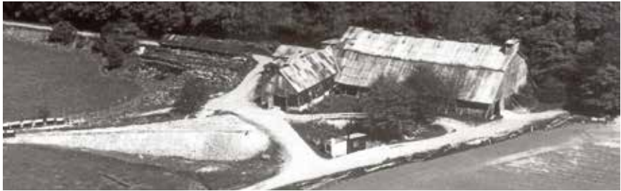
Aastrup Kalkværk, set fra luften (foto: Tølløse Lokalkiv).

I Elverdamsdalen på højde med Frstrup lå Aastrup kalkværk. Her blev der indtil en gang i tresserne udvundet kildekalk. Kildekalken er dannet over mange tusinde år ved udfældning af kalk og okker fra store kildevæld, herunder Røde kilde ved Hestemølle (i de ældre kilder også kaldet 'Heslemølle' – hesle = hassel). Kalkaflejringen fortsætter stadigvæk, som man kan se, når man følger lærestien langs med Røde kildes rende. (se: Spor i landskabet.)