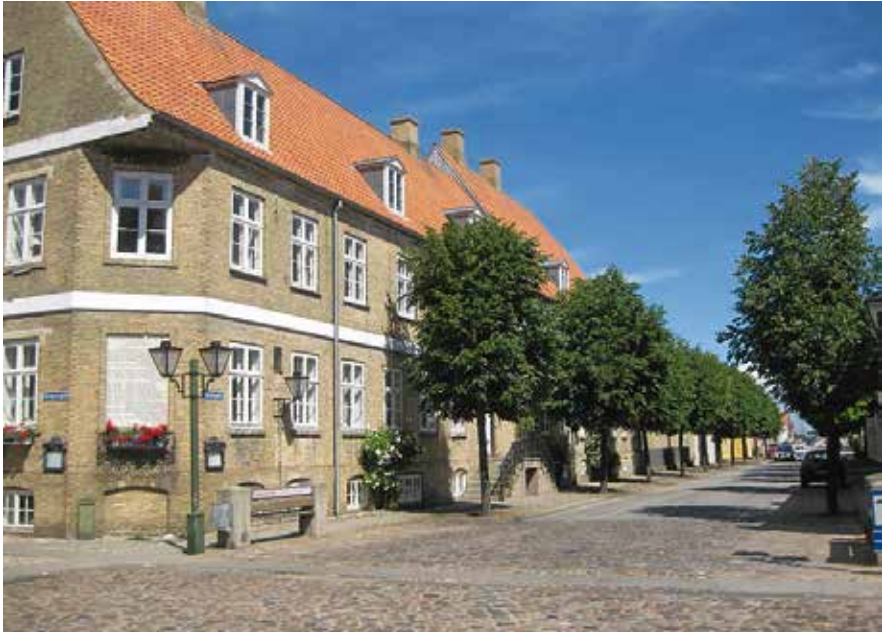
Gadeparti fra Christiansfeld.

han Huss, den böhmiske reformator, som led martyrdøden for sin religiøse overbevisning. I 1722 samlede grev Zinzendorf de sidste rester af 'de mähriske brødre' og skabte en række evangeliske småsamfund under navnet Herrnhuterne. De fik bred anerkendelse for deres dygtige og hæderlige håndværkere. Navnet herrnhuter kommer fra den første by, som menigheden grundlagde: Herrnhut - herrens vareretægt.