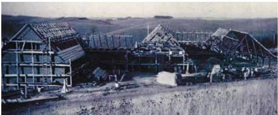
Observatoriet i Brorfelde bygges.

Med projektet i Brorfelde fulgte en international navnkundig astrofysiker til Tølløse. Ejnar Hertzsprung