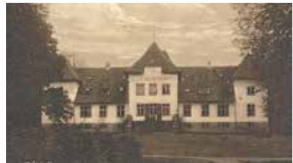
Hovedbygningen på Bonderupgaard

Astronomien blev med tiden en populær videnskab; bl.a. blev der bygget flere herregårdsobservatorier, hvor godsejeren kunne studere himmellegemerne eller fra sit høje udkigspunkt skue ud over sine jorder. Et spøjst eksempel er Køng kirke, som af godsejeren, Niels Ryberg i slutningen af 1700-tallet blev forsynet med et nyt tårn med observatorium – det var før man tænkte på fredning af vore middelalderkirker.