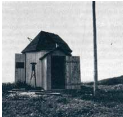
Skuret på Hyldebjerg, hvor Observator Gyldenkerne foretog de første målinger.

forureningen havde efterhånden umuliggjort observationer i hovedstaden, og i halvtredserne opførte man så Observatoriet i Brorfelde med fire store kikkertør, til dels betalt med midler fra Carlsbergfonden. Hovedbygningen, værkstedet og astronomernes huse blev tegnet af kgl. bygningsinspektør Kaj Gottlob (1887-1976). Det var Gottlob magtpåliggende, at bygningerne skulle falde naturligt ind i det smukke landskab, og de blev bygget af materialer, som var almindelige i området: gule mursten og røde tegl. Han lod sig inspirere af