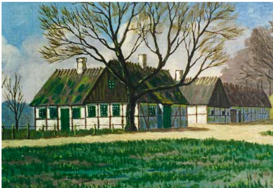
Skovlyst, skovfogedhuset i Fledskov, malet af Aage Frederiksen (1959).

gav mig strænge Ordre til at være her førend han stod op, saa skulle jeg sige, at Baronen kom herop senere i Dag.