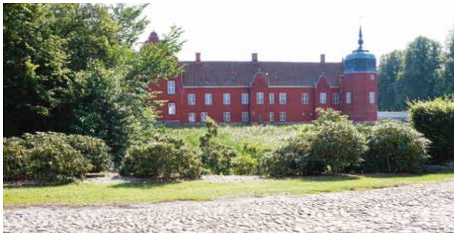
Løvenborg (foto: Inge-Lis Madsen, 2015).