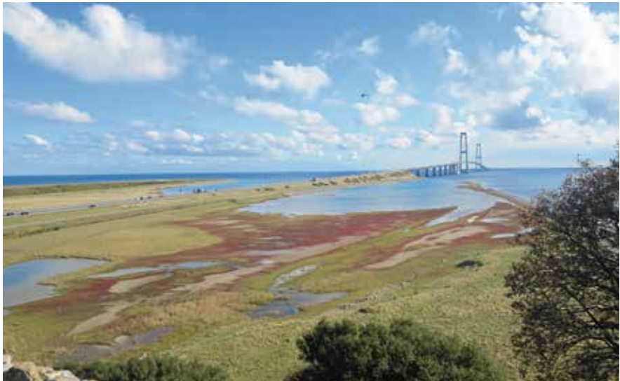
Sprogø anno 2013.