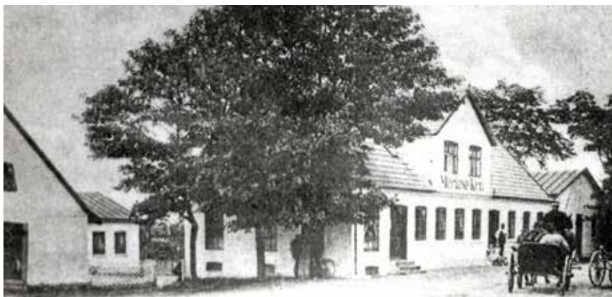
Merløse Kro, Bygaden 1, hvor diligencen havde holdeplads. Datering: 1909.