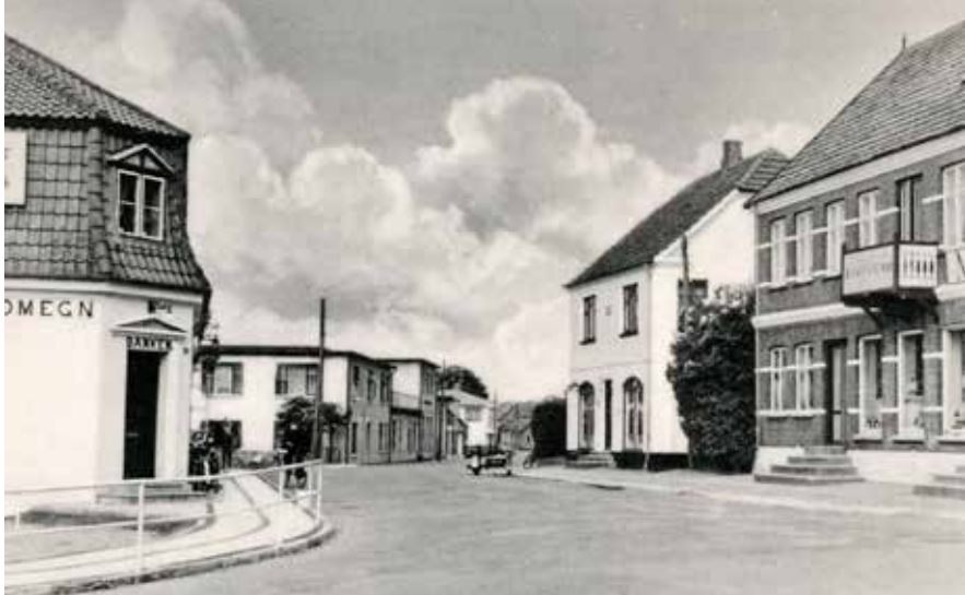
Bygaden i St. Merløse set mod øst med kro, andelsmejeri og masser af forretninger. Postkort, udateret.