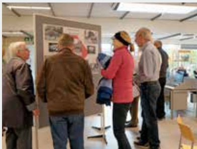
Gæster på Arkivernes Dag 2015.

Gå ikke glip af en hyggelig dag med masser af lokalhistorie, og sæt derfor allerede nu kryds i kalenderen!