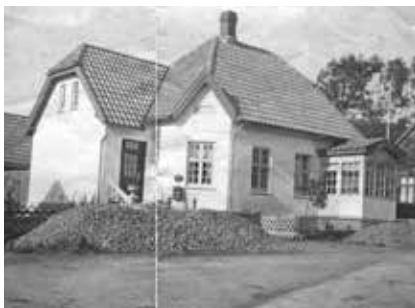
Ugerløse Posthus, Hovedgaden 10 – posthus fra 1917-1963. Udateret.

on er nedgraderet til postbutik til de mest basale posttjenester. anbefalede breve eller postpakker til udlandet kan ikke længere sendes fra Tølløse. Holbæk Posthus blev lukket i 2013, og postekspeditionen blev også der nedgraderet til en postbutik i Kvickly i Slotscentret. Sidste minde om postkontoret i Holbæk er de mange parkerede postbiler (karrygule med dronningens monogram og krone) ved stationen.