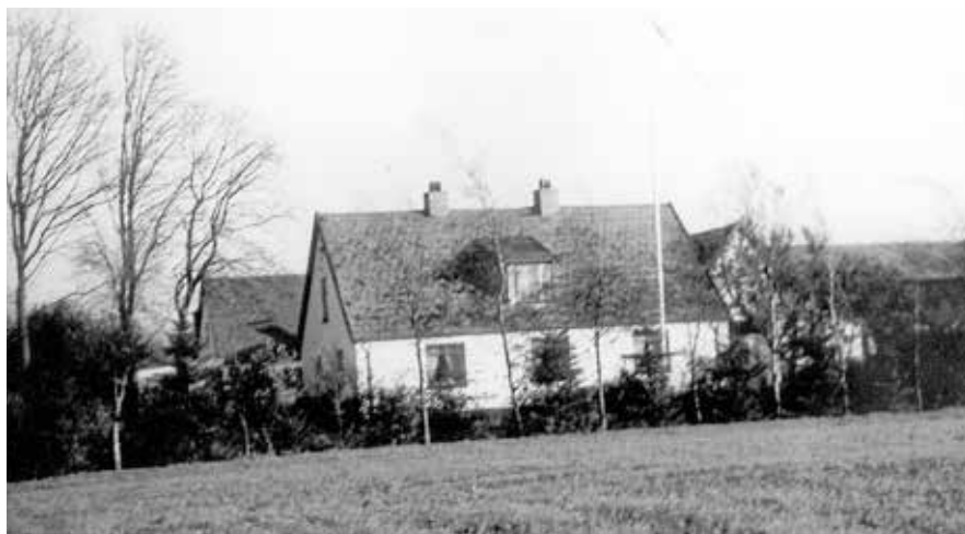
Bobjerggård, Nederskovvej 127, Skov Vallenderød. Datering: 1970.

Om foråret skulle huset have den helt store omgang. Hovedrengøring havde jeg lært i mine pladser, så jeg vidste, hvordan det skulle gøres. Alt sengetøj og alle møbler blev slæbt udenfor, børstet og banket. Døre, vinduer og træmøbler blev vasket af, sølvtøj pudset