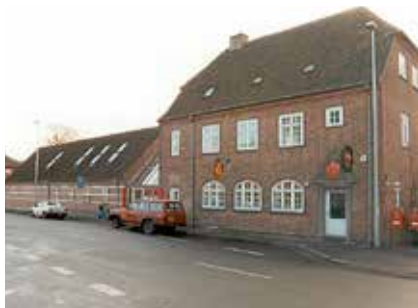
Tølløse Posthus med den nye tilbygning. Datering: 1999.