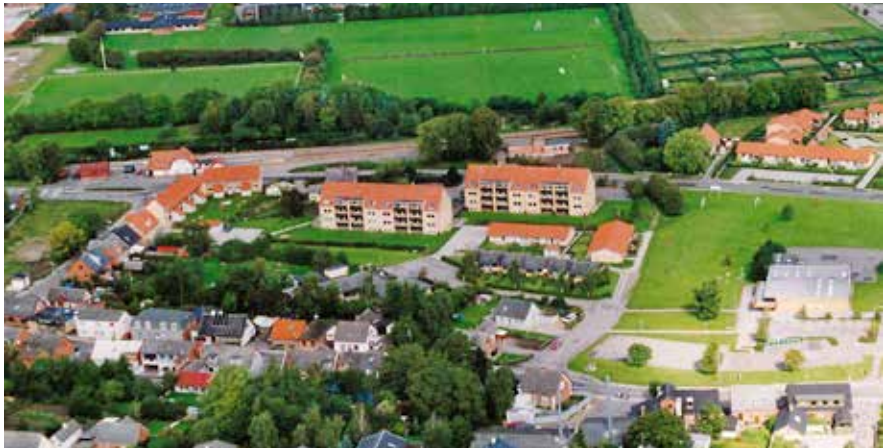
Et vue ud over St. Merløse. Foto: Mogens Stjernqvist, 1992.

Efter byvandringen serveres et traktement på Møllevang. Pris inkl. traktement 100 kr./prs. Max. 40 deltagere. Tilmelding senest d. 07.06.2018 på tlf. til Carsten Kristoffersen (tlf. 31 42 48 84) eller Vivian Pihl (tlf. 60 62 71 74). Afslutning ca. kl. 21.15.