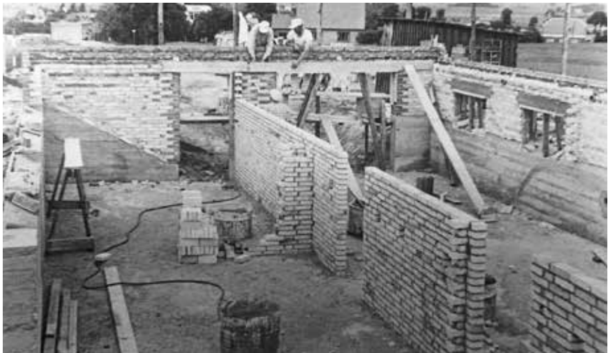
Der bygges på Bakken i St. Merløse.

I starten af 1970'erne begyndte man at bygge i Pip-kvarteret, og Bakken blev i samme periode udbygget. Senere kom der mere byggeri til i Pip-kvarteret, og der opstod en hel ny bydel i Åparken med omkring 50 huse. Det sidste større byggeri er sket på Bybjerggårdens jorder, hvor der er bygget almene boliger.