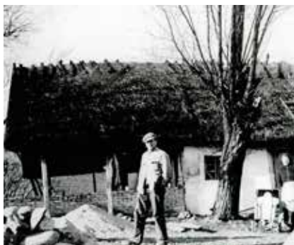
Bindingsværk udskiftes med mursten. Jernløse Lokalhistoriske Arkiv, datering: 1920-30.