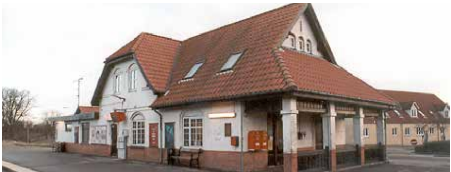
St. Merløse Station og Postekspedition. Datering: 1999.