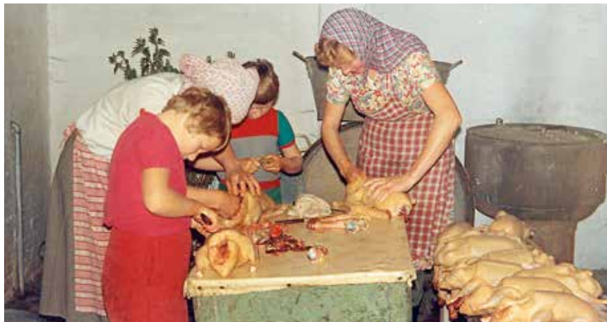
Der slagtes ænder på Bobjerggård – både børn og voksne er beskæftiget. Datering: ca. 1966.

de var vi til dels selvforsynende – de forskellige ting rakte i hvert fald langt. Dertil blev fryseboksen en uvurderlig hjælp til opbevaring af fødevarer. Inden længe lærte man også at kunne fryse frugt, grøntsager og bagværk. Men hvad angår