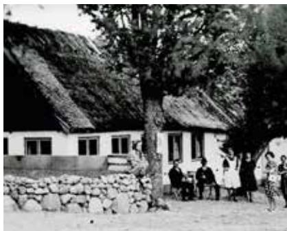
Gæster på traktørstedet.