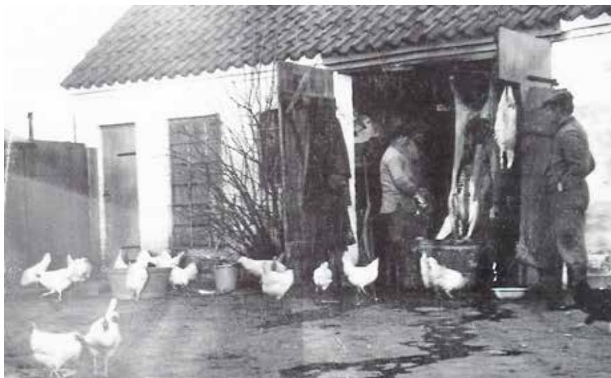
Hjemmeslagteren på besøg – dog ikke på Bobjerggård, men på Grønholmvej 32, Tølløse Mark. Datering: 1944.

te hjemmeslagteren. Hos os som i de fleste andre husstande foregik slagtingerne forår og efterår, når det ikke var så varmt – det var jo før fryseboksens tid!