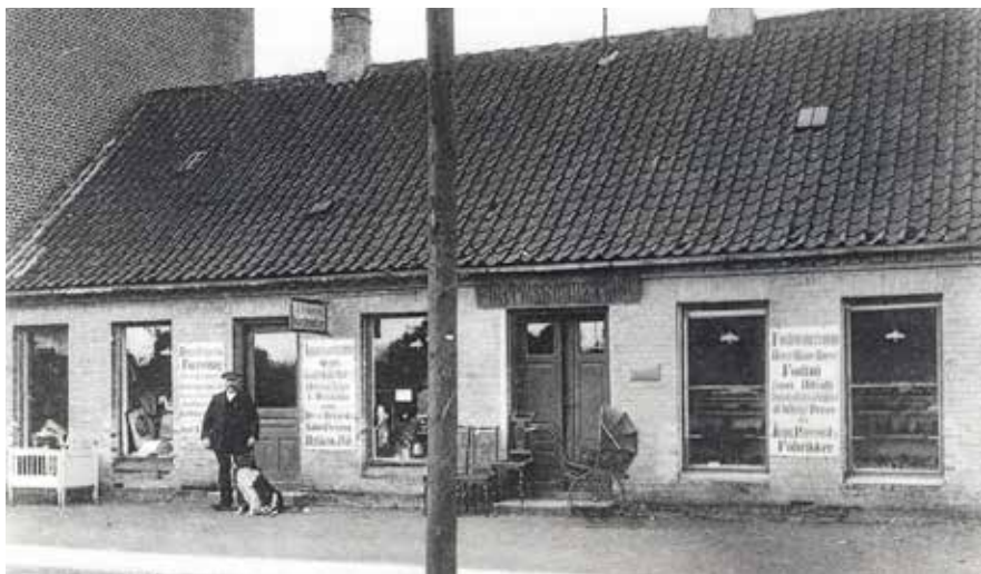
I denne bygning på Jernbanevej 14 i Tølløse var der midlertidigt posthus. Datering: 1913.