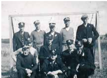
Postbude fra Tølløse spiller fodbold ved byfest. Udateret.

I Lokalarkivet findes et righoldigt udvalg af fotografier af postmestre, postbude og landpostbude fra hele postdistrikt Tølløse. Fra Postmuseet 8 har vi modtaget en oversigt fra 1933 over de ansatte med angivelse af navn, fødselsår, forældres navne, oprindeligt erhverv (mange landmænd) og deres rute. Der var i det år i Tølløse postdistrikt i alt 32 postbude og landpostbude, der var tilknyttet de forskellige ekspeditionssteder. 9