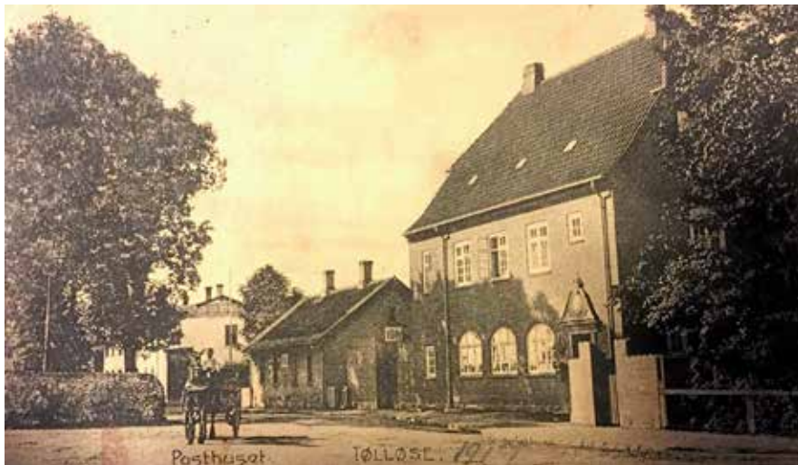
Tølløse Posthus, Jernbanevej 20, bygget i 1910. Datering: 1917.

antallet af postforsendelser, herunder pakkeforsendelser, eksplosivt. Også den bedre skoleundervisning, hvor alle børn i princippet lærte at læse og skrive, bidrog til postmængden. Antallet af breve pr. indbygger i Holbæk Amt voksede fra 4 i 1874-75 til 34 i 1907-08 2 . I 1999 sendte danskerne endnu 1,46 mia. breve med PostDanmark. Sidenhen er tallet styrtdykket med den stigende anvendelse af e-mail, e-post og Nem-Id, men allerede inden da havde postvæsenet gennemgået en række rationaliseringer, som ikke fremmede den service, man kunne forvente af en offentlig tjeneste.