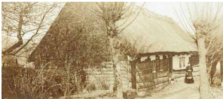
Trouborghuset. Jernløse Lokalhistoriske Arkiv, udateret.