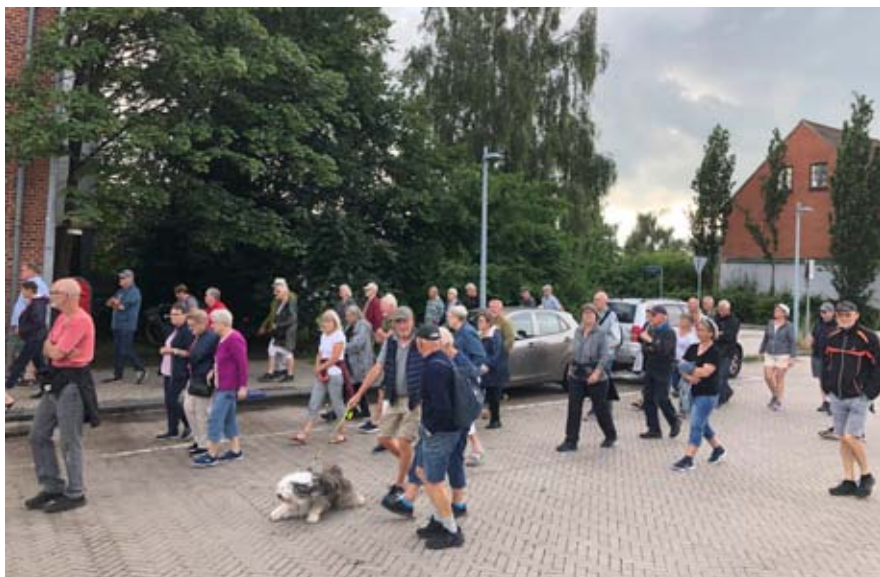
Byvandringen på Jernbanevej.