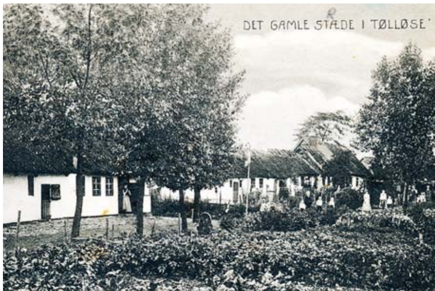
Postkort fra "Det gamle Stræde" (i dag Kærvej) i Gl. Tølløse. Udateret.