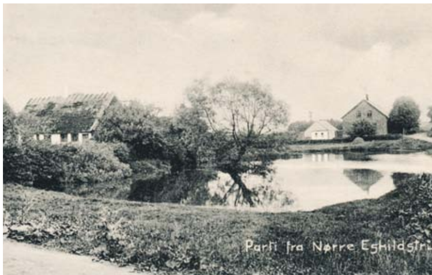
Nr. Eskilstrup med gadekæret i forgrunden og bag det Baptistkapellet Elim. Postkort, dateret 1903.