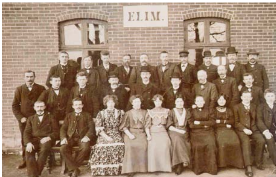
Møde for søndagsskolelærere i Baptistkapellet Elim ca. 1911.