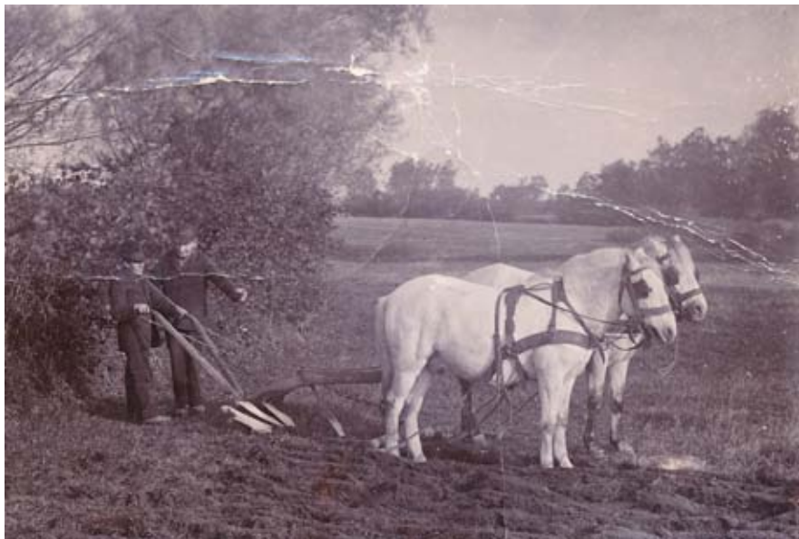
Ældre mand underviser en karl (dog ikke Anton Andersen) i pløjningens kunst. Udateret.

Høstarbejdet var allerede på dette tidspunkt, i forhold til i tidligere tider, hvor man høstede med le, mekaniseret så meget, at man