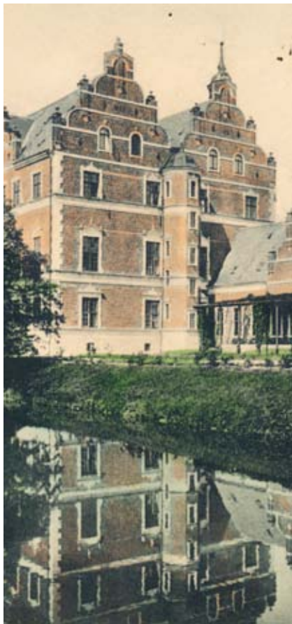
Tølløse Slot med voldgraven i forgrunden. Udateret postkort.