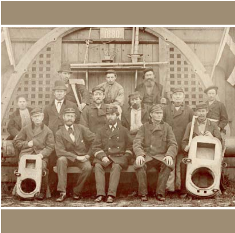
Personalet ved Mastemagerværkstedet 1880. Læs artiklen om en lokal mastemager inde i bladet.