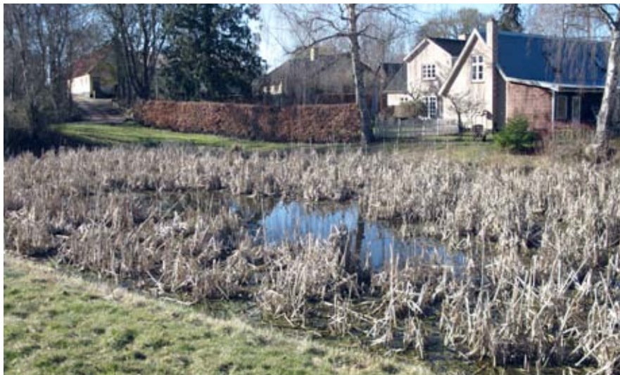
Gadekæret i Nr. Eskilstrup i dag.

Kun Højbjerggård (matr. 5a, der lå ved km. stenen på Skovbakke-