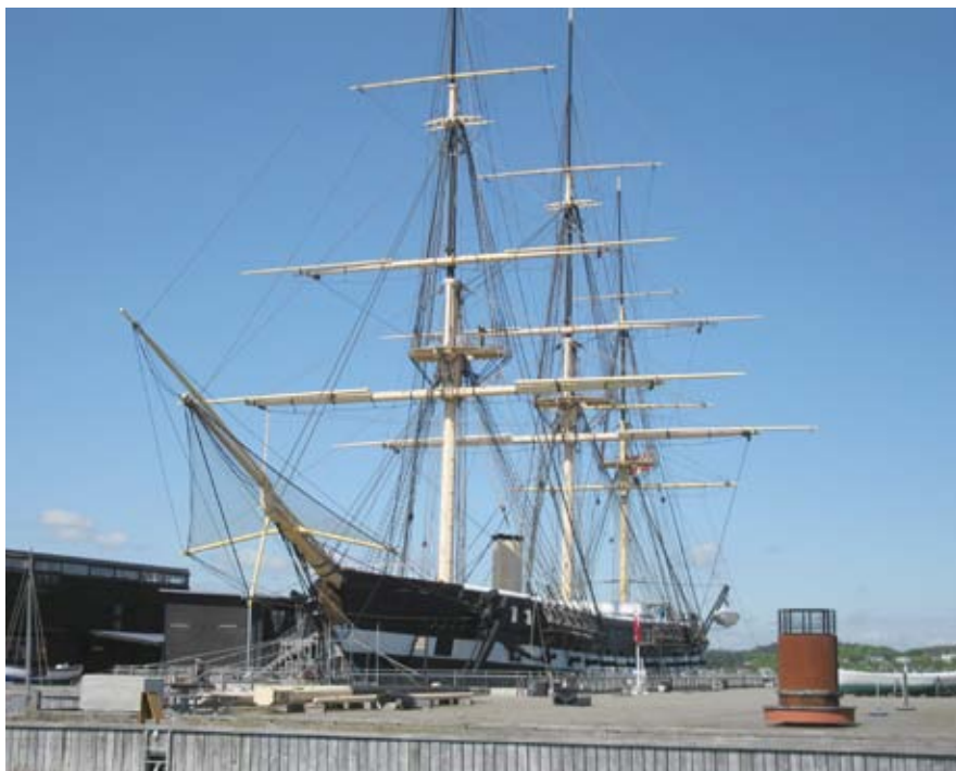
Måske har Johan Christian været med til at lave masterne til Fregatten Jylland, der blev søsat i 1860.

Holmens kirke og kom i lære som skibstømrer på Holmen. Noget tyder på, at familien allerede i 1817 har haft en plan, og de har haft tilknytning til Holmen.