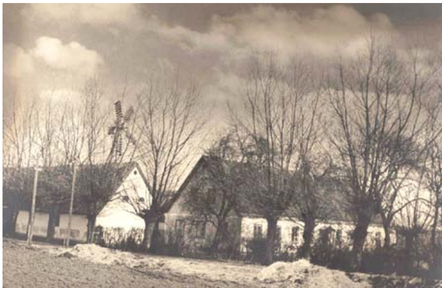
Højberggård blev flyttet ud på marken og har i dag adressen Højbjergvej 21. Udateret foto.