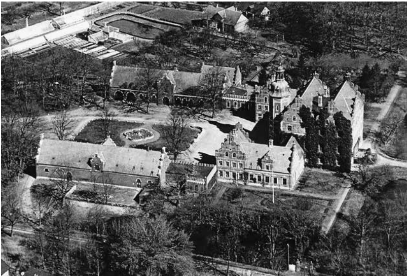
Tølløse Slot med gartnerboligen i baggrunden.