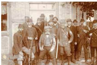
Jagtselskab ved Tølløse Slot. (Datering: 1890'erne)