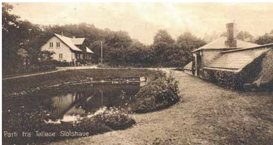
Gartneriet og gartnerboligen ved Tølløse Slot, der blev revet ned sidst i 1970'erne i forbindelse med, at Havebrugsskolen Vilvorde skulle opføre elevfløje.

Dog en ting fattedes ved den have, ikke at ledet var af lave, men rislende vand i grotter, små-åer etc.