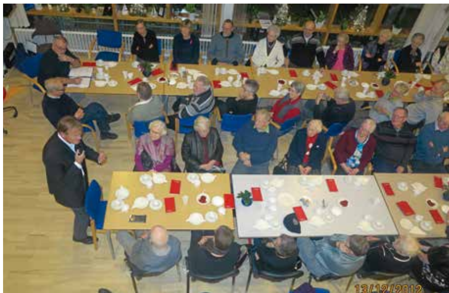
Et lille udsnit af tilhørerne - set fra oven - ved Poul Joachim Stenders foredrag i Aktivitetshuset den 13. december 2012. (Foto: Erik Lausen).

Sognepræst Lise Trap, Soderup: Julemøde / - hygge