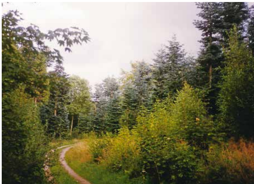
Parti fra Mølleskoven. (Datering: august 1993)