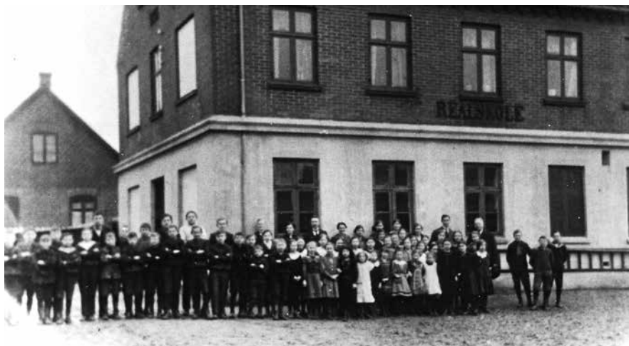
Elever foran Tølløse Realskole.

løst, og forældrene hørte først fra ham ca. 1 årstid efter, nemlig fra Sydamerika, da han havde taget hyre på en bark og var nået dertil. Han blev senere en dygtig sømand, styrmand etc. Og havnede på landjorden som havarieksperter hos et assuranceselskab.