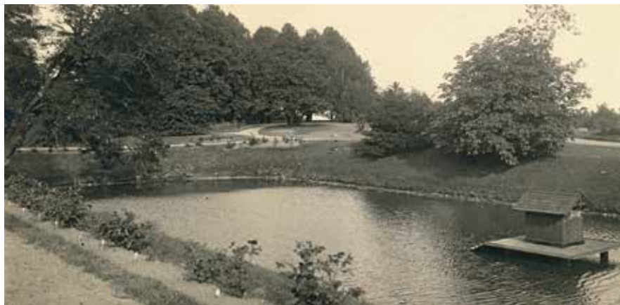
Parti fra parken ved Tølløse Slot med en af voldgravene i forgrunden. (Datering: 1890'erne).

Fiskeri blev også drevet i havens damme, hvor resultatet ofte blev en salamander på krognen. Men