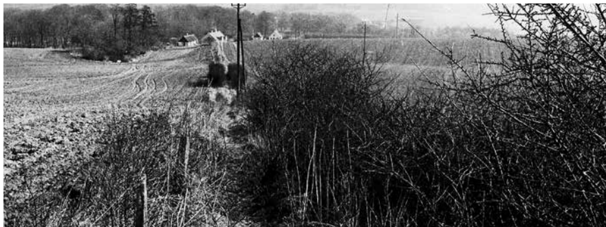
Hovstien fra Kvarmløse til Aastrup, som den lille dreng spadserede ad. (Datering: 1972)