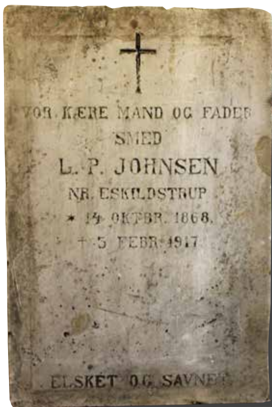
Smedens gravsten, fundet i kælderen på Norddjurs.