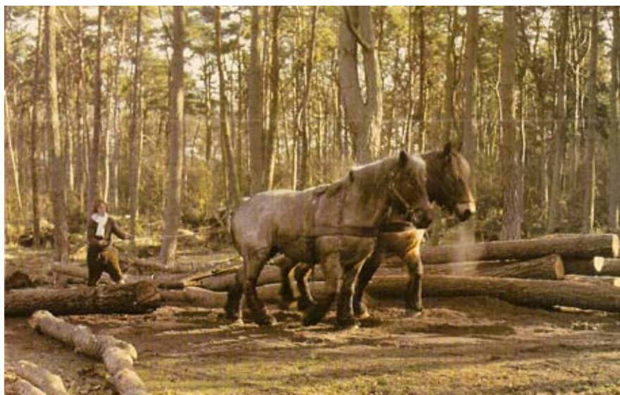
Heste slæber træ ud ad skoven. Fra reklamekalender for melfabrik i Friesland.