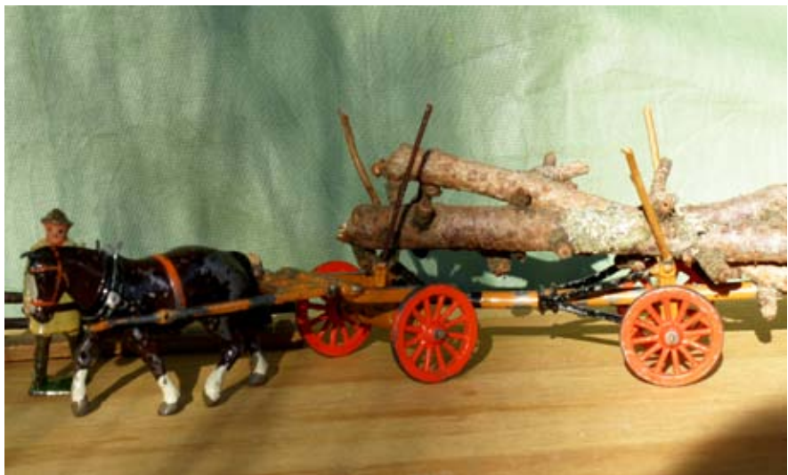
Også bybørn skulle lære om skovens arbejde - legetøj fra 1920'erne.

at forny sig. Egetræer har en om-drift på 150 år, før de er tjenlige til skibstømmer, og da englænderne havde taget den danske flåde i 1807, var der ikke tilstrækkeligt egetømmer i kronens skove til at bygge nye krigsskibe. Krigen mod englænderne måtte derfor af nød føres med små kanonbåde. Det blev til Kanonbådskrigen, en slags kongeligt autoriseret pirateri. Kronens skovridere fik ordre til at plante ny egeskov, de såkaldte flådeegge. Så sent som i halvfemserne morede Dyrehavens skovrider sig med at sende besked om, at nu var flådeegene tjenlige til bygning af en ny flåde. Det skabte en del morskab hos Søværnet, som på de sidste rester af Lindøværfet