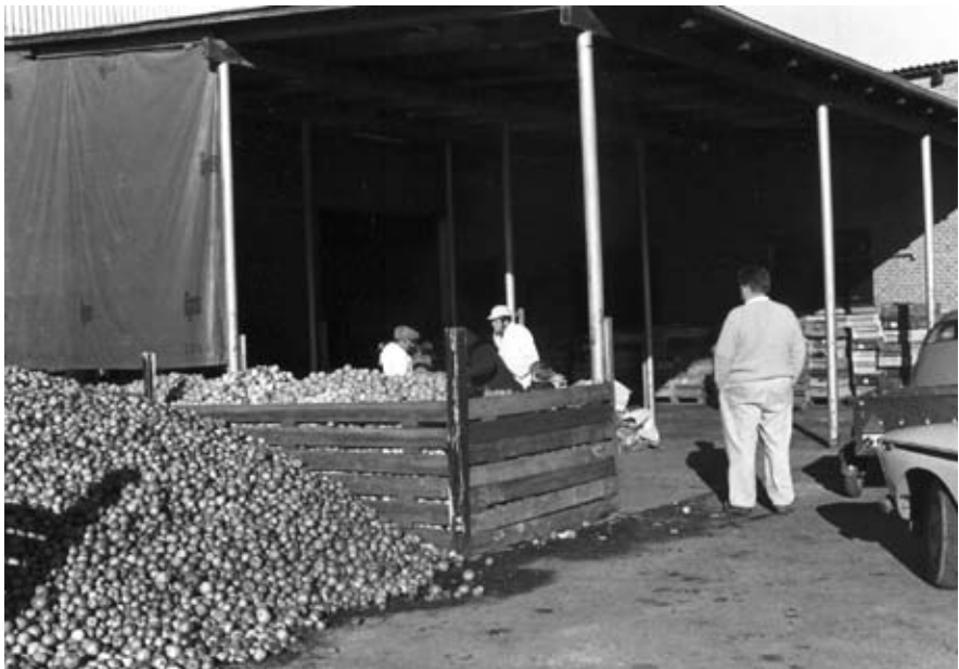
Aflæsning af æbler på Dansk Centralmost, Tølløsevej 27. Datering: 1972.