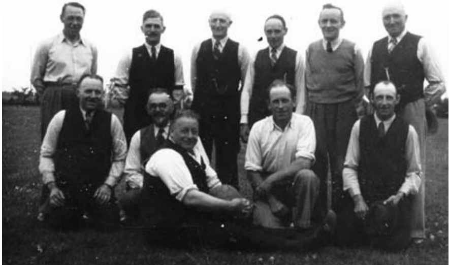
Sognerådets fodboldhold ved showkamp mod Tølløse Handelsstandsforening 1942-43.