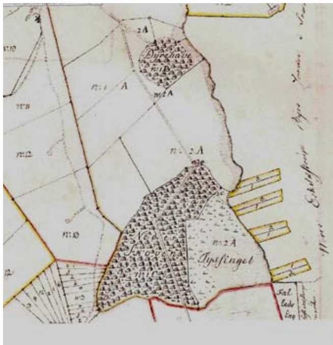
Kort over Tølløse Dyrehave og Nederskoven, 1816.