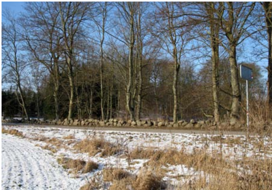
Stendige ved Aastrup. Foto: Marina Wijngaard, 2012.

I slutningen af 1700-tallet var kun ca. 3% af Danmarks areal skovdækket. I 1806 beskrives en skov i Ramsø herred: 'de faa tilovers-