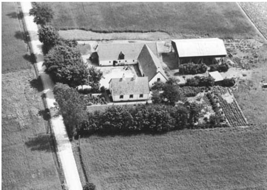
Bobjerggård, Nederskovvej 127, Skov Vallenderød.