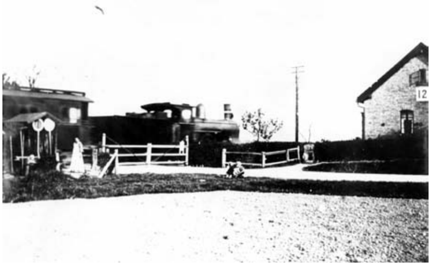
Jernbaneoverskæringen i Skimmede med banehus nr. 12 til h. Datering: 1911.