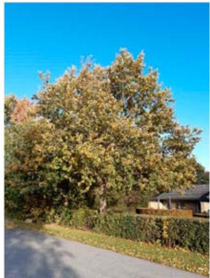
Grundlovstræerne i Kr. Eskilstrup og Ugerløse tv. - i Kvarmløse og St. Merløse ovenfor.