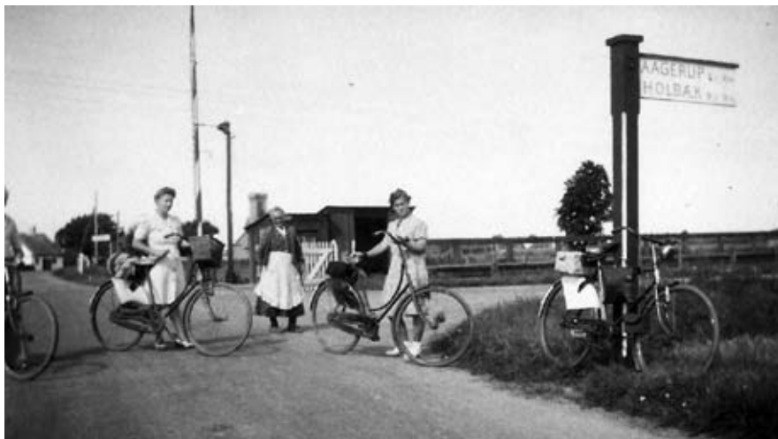
Cyklister ved trinbrættet i Skimmede med banevogtersken midt i billedet. I baggrunden det lille venterum med bænke. Udateret.