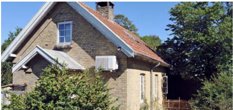
Banehuset ved Mejnertsens gård aug. 2020, kort tid inden det blev revet ned.