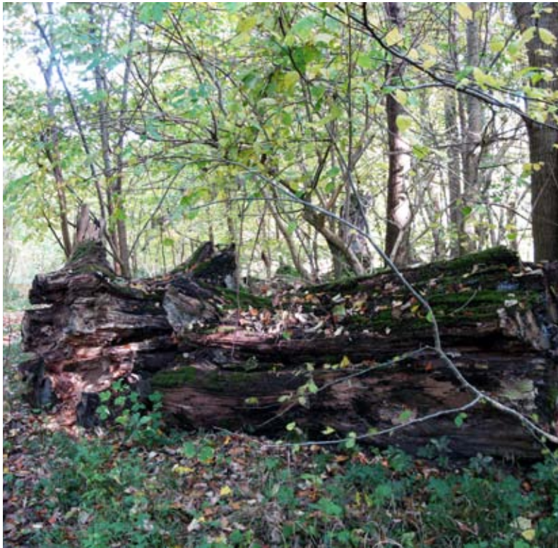
Fra produktionsskov til naturskov - en falden kæmpe i Tølløse Dyrehave.