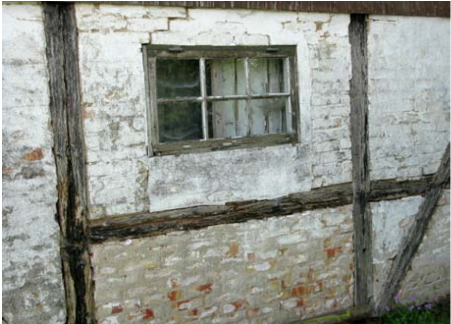
Fattigt bindingsværk.

mark blev bindingsværk. 5 Når man nu taler om 'fattigt sjællandsk bindingsværk', skyldes det simpelthen mangel på ordentligt tømmer. Til opførelse af slotte, palæer og store købmanshuse indførte man pommersk fyr. Norge stod for levering af bl.a. skibsmaster.