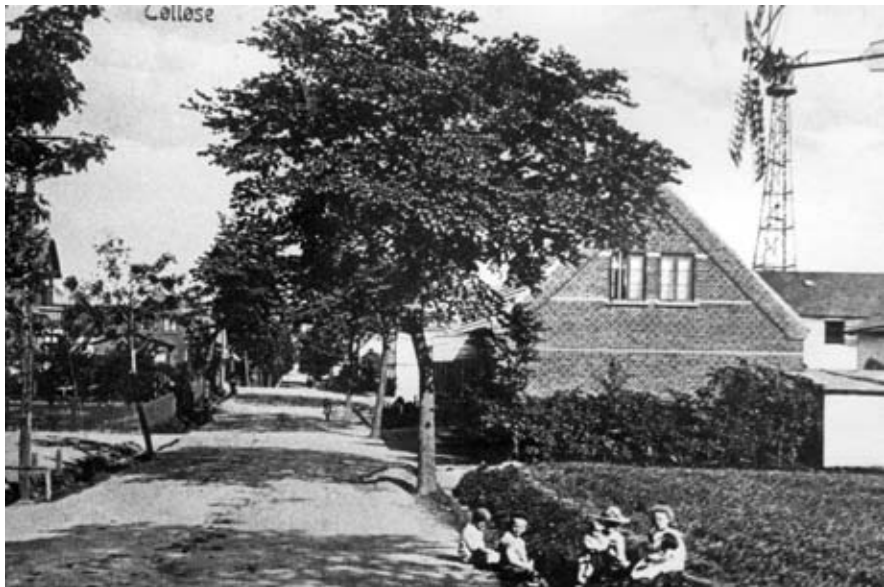
Tølløsevej set mod øst med møllen på Møllevej t.h. Billedet er taget inden hovedbygningen ud mod vejen blev opført.

Hvordan kom Mosten til at ligge nærmest midt i byen? Da Mosten blev oprettet, lå den afgjort i byens udkant. Vestergade fandtes ikke endnu, og der var kornmark der, hvor vi nu har supermarkederne. Men der synes at have været en sti, der førte fra Aastrup til Tøllø-