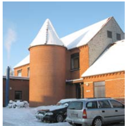
Trappetårnet ved hovedbygningen. Foto: Marina Wijngaard, 2010.