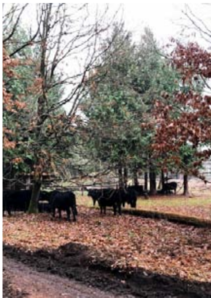
Det fritgående Angus kvæg i Tølløse Dyrehave. Foto: Inge-Lis Madsen, nov. 2020.

Andre skove, herunder Sandlyng Skov, får nu lov til at ligge hen som naturskov uden skovgræsning.